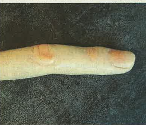
dem Finger geschrieben.

Im Grunde aber wollte ich nur schauen, was es Neues gibt im Kuriositätenkabinett. Nun, Hundehaufen aus Plastik, kenn ich noch aus der Kindheit. Pfefferbomben, auch: Falsche Zigaretten mit Puderqualm, Wunden aus Plastik, allerlei falsches Getier, Kaugummiverpackungen mit eingebauter Fingerfalle, Quabbelmasse, selbst Zungen-tattoos auf Oblaten sind mir ebenfalls bekannt. In diesen bewegten Zeiten scheint der Scherzartikelmarkt ein Musterbeispiel an Beständigkeit zu sein. Er steht in Treue zum Klassiker. Sollte diese Branche je in eine existenzielle Krise stürzen, dann liegt es entweder daran, dass die orangenen Toupets den normalen Alltag dominieren oder dass niemand sich mehr etwas vormachen lassen will, noch nicht mal von einem lustigen Gebiss.