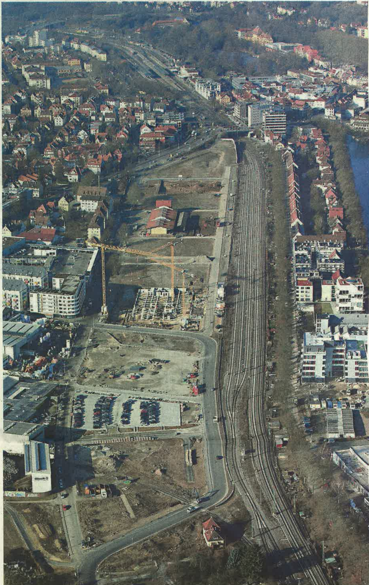
Auf dem Tübinger Güterbahnhof-Areal werden einmal über 1000 Menschen wohnen. Ganz zuletzt wird die historische Güterhalle (oberhalb der gelben Kräne) renoviert – sie soll einmal das Stadtarchiv und ein Café beherbergen. Davor ist, ab 2018, der Kopfbau auf dem Spitz bei der Blauen Brücke dran. Verschwinden wird, im Gewerbeteil des Areals (unterhalb der Kräne), ein Stück Eisenbahnstraße. Hier erweitern unter anderem Kemmler und Möck in Richtung des neuen Straßenschlenkers entlang der Gleise.

Bundesweit finanziert die Umweltbank nach eigenen Angaben rund 21 500 „Umweltprojekte“ – von Erneuerbaren Energien bis zu Ökohäusern. Letztere dürfen gerne auch sozial gefördert sein. Die 93 neuen Tübinger Sozialwohnun-